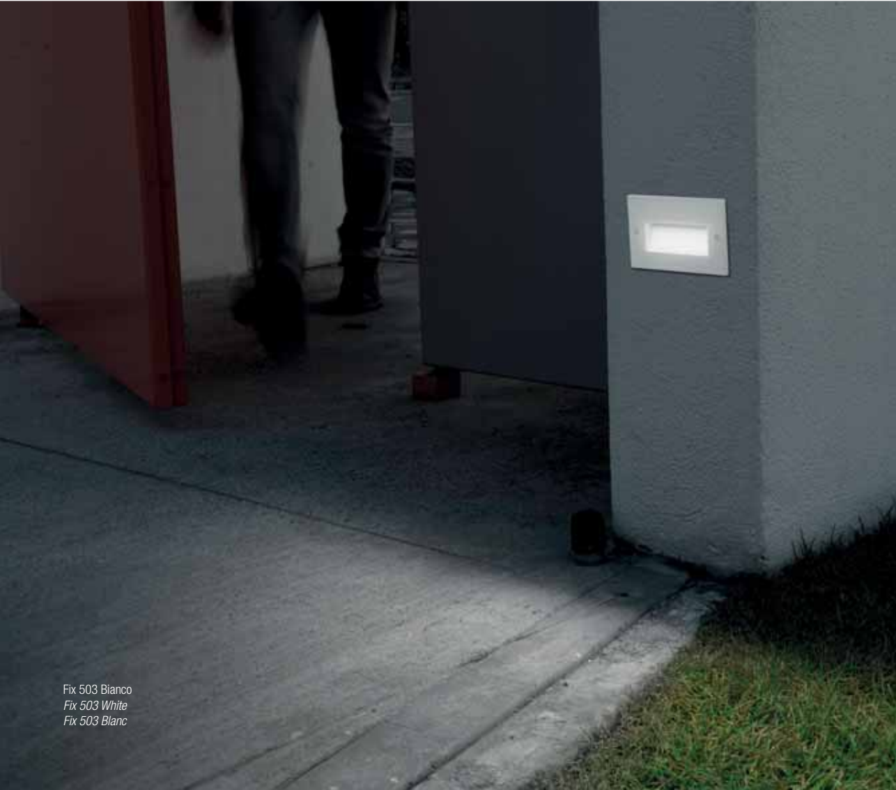
Fix 503 Bianco Fix 503 White Fix 503 Blanc