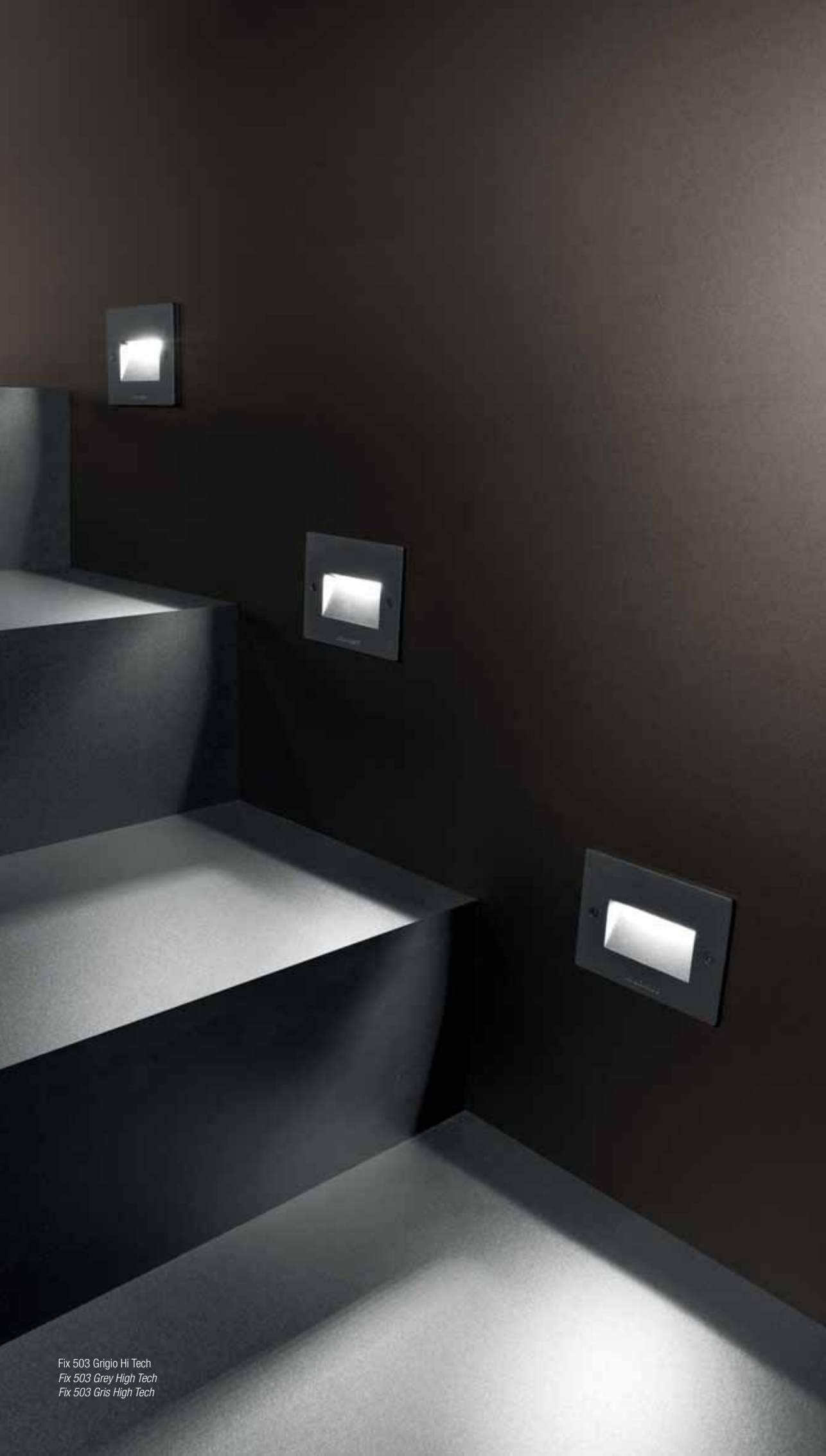
Fix 503 Grigio Hi Tech Fix 503 Grey High Tech Fix 503 Gris High Tech