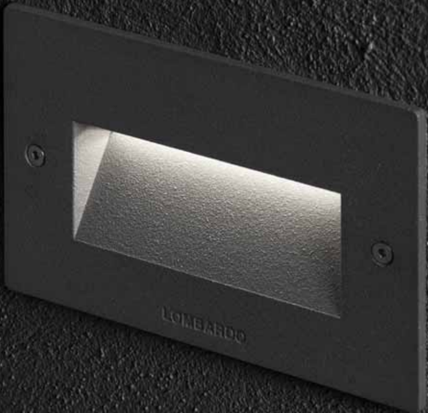
Fix 503 Grigio Antracite Fix 503 Grey Anthracite Fix 503 Gris Anthracite