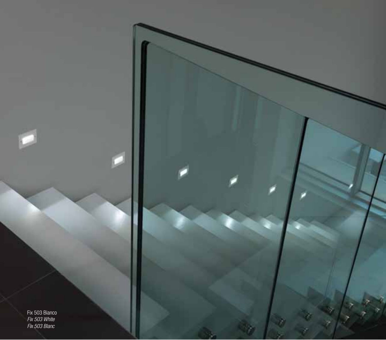
Fix 503 Bianco Fix 503 White Fix 503 Blanc