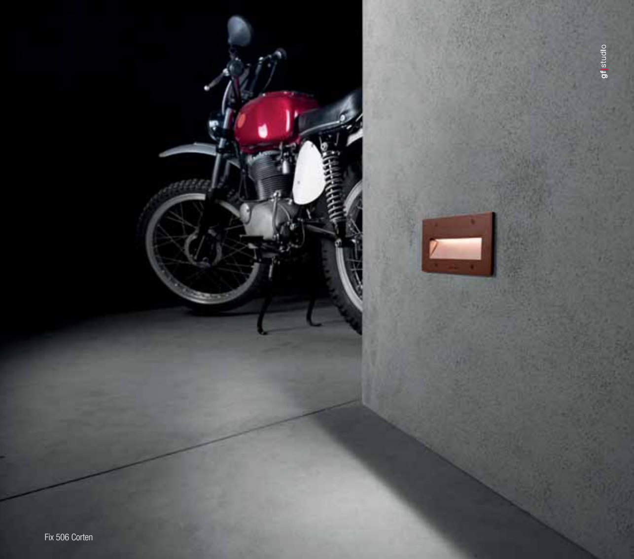
Fix 506 Corten